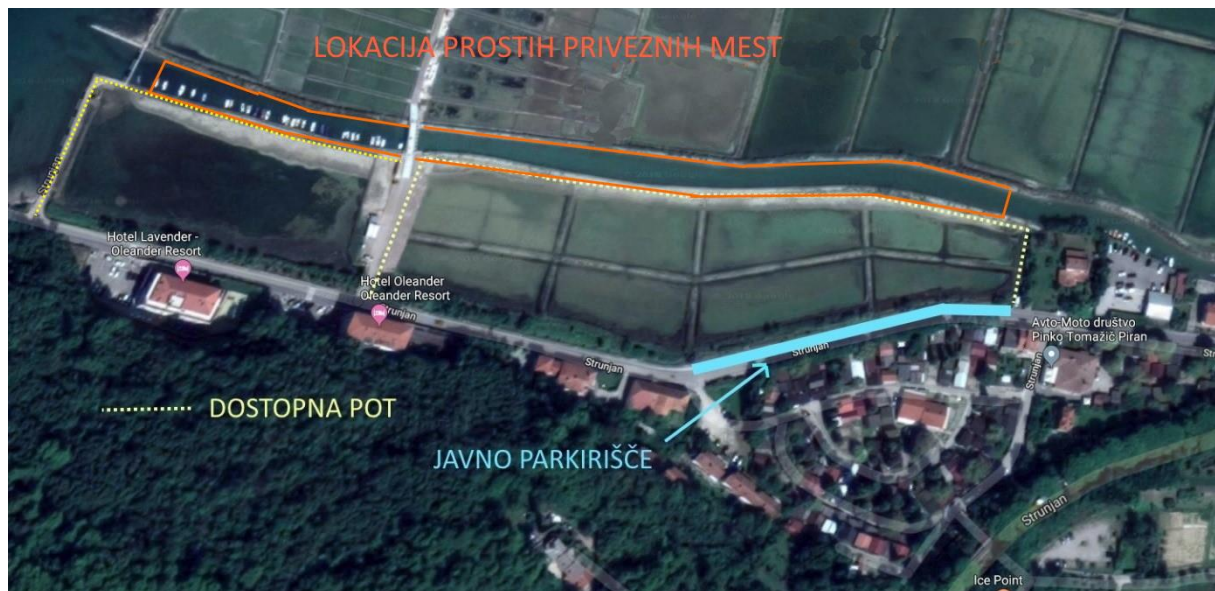
Skica lokacije prostih priveznih mest, dostopne poti in parkirna mesta.

DŠ: SI33414009 MŠ: 3452085000 UJP: SI56 0110 0600 0027 668